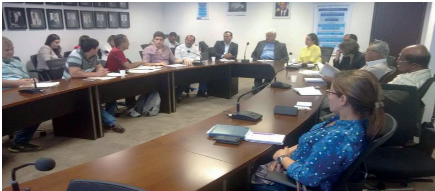
A maioria dos pontos foi negada pelo Governo e aqueles com possibilidades de serem atendidos foram para análise

As pautas de reivindicações dos trabalhadores públicos da Agência Estadual do Meio Ambiente (CPRH) e Agência Pernambucana de Águas e Climas (Apac), com o Governo do Estado, não conseguiram ser fechadas nas Mesas Específicas realizadas pela Secretaria de Administração (SAD), com o Sintape e representantes das duas agências. A maioria dos pontos foi negada pela esfera governamental e aqueles com possibilidades de serem atendidos, foram para a análise no setor de gestão de pessoas e de finanças da pasta.